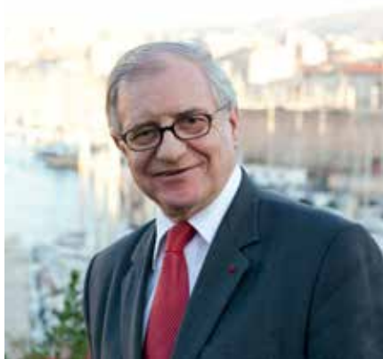
Dominique Balmay Président de l'Uniopss